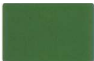
Verde Musgo / Moss Green (6005)