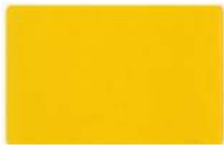
Amarillo Señales / Signal Yellow (1003)