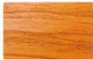
Roble / Oak Wood