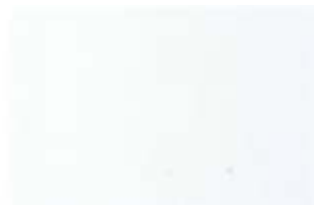
Blanco Trafico / Traffic White (9016)