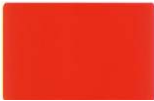
Rojo Vivo / Flame Red (3000)