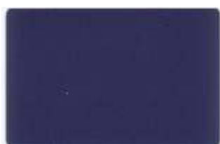
Azul Acero / Steel Blue (5011)