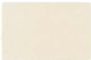
Crema / Cream